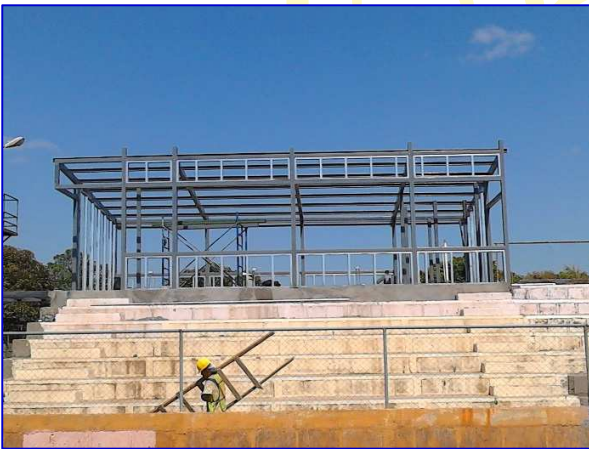
Construcción de la cabina de transmisión; de estructura metálica y forro de plyrock y siding.

El proyecto consiste en la construcción de pista de atletismo para calentamiento con superficie asfáltica, con una dimensión longitudinal de 132.00 m con 4 carriles, sala de certificación, fotofinish y sala técnica. A la vez se rehabilitará los servicios sanitarios para el público y camerinos en áreas techadas y no techadas del estadio; mejoramiento de accesos principales, mejoramiento de graderías y obras exteriores para brindar un mejor confort a los atletas y público en general.