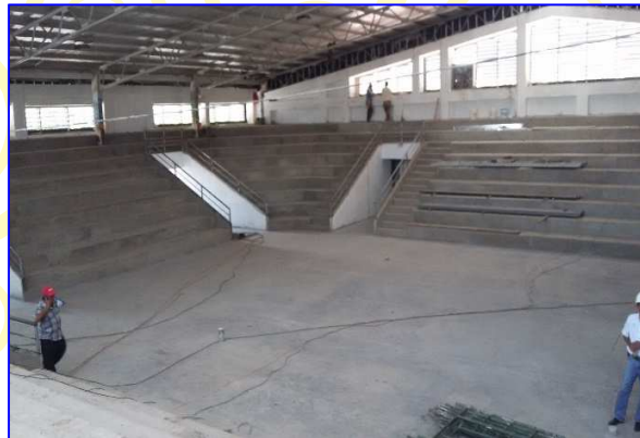
Vista interna del área graderías donde se observa la finalización de construcción de losa de concreto reforzado en área del cuadrilátero y pasillos de accesos.