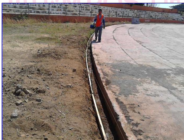
Apreciar los trabajos de excavación de bordillo de protección de la pista y remoción de pista sintética.