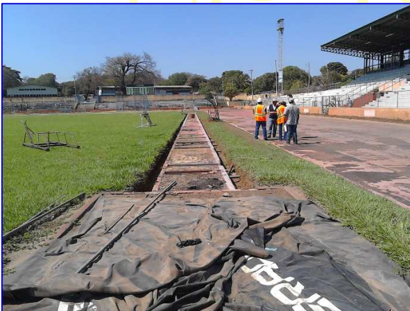
Vista panorámica de la Pista de Atletismo, a la izquierda apreciar la construcción de carrilera salto y salto triple y a la derecha observar los trabajos de movimiento de tierra en el sector D de la pista de atletismo.

El proyecto está siendo ejecutado por el contratista Consorcio Canchas Deportivas, por un monto de C$ 14,128,076.00. La obra se inició el 07 de febrero 2017, con un plazo de ejecución de 160 días calendario, teniendo previsto la finalización el 16 de julio del 2017.